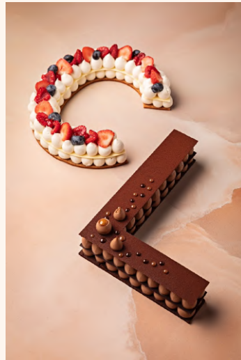
Number / Letter cakes